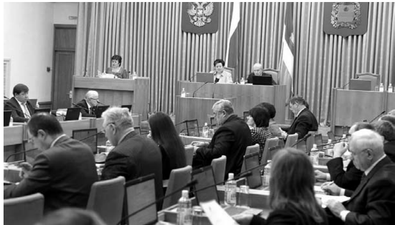
делителей за привлеченных работников. По нашему мнению, должен приглашаться именно специалист, причем востребованный на рынке труда. В противном случае, мигрант, оказавшись невостребованным, будет искать источники пропитания, пополнять преступные группировки».

Также дополнениями предлагалось установить штрафы за нарушение установленных органами местного самоуправления сроков демонтажа подлежащих сносу временных объектов. Законопроект не был рассмотрен,